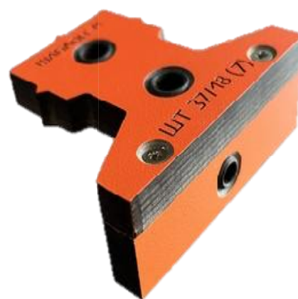
Рисунок 3 – Мебельный кондуктор для сверления петель