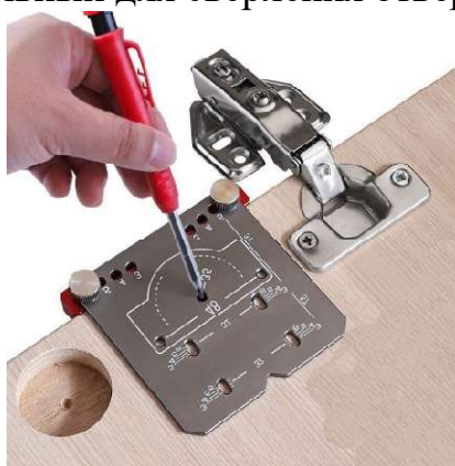
Рисунок 2 – Мебельный кондуктор для сверления петель