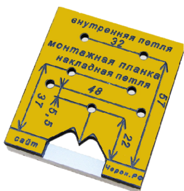
Рисунок 1 – Мебельный кондуктор для сверления

Изделие: Кондуктор мебельный для сверления отверстий